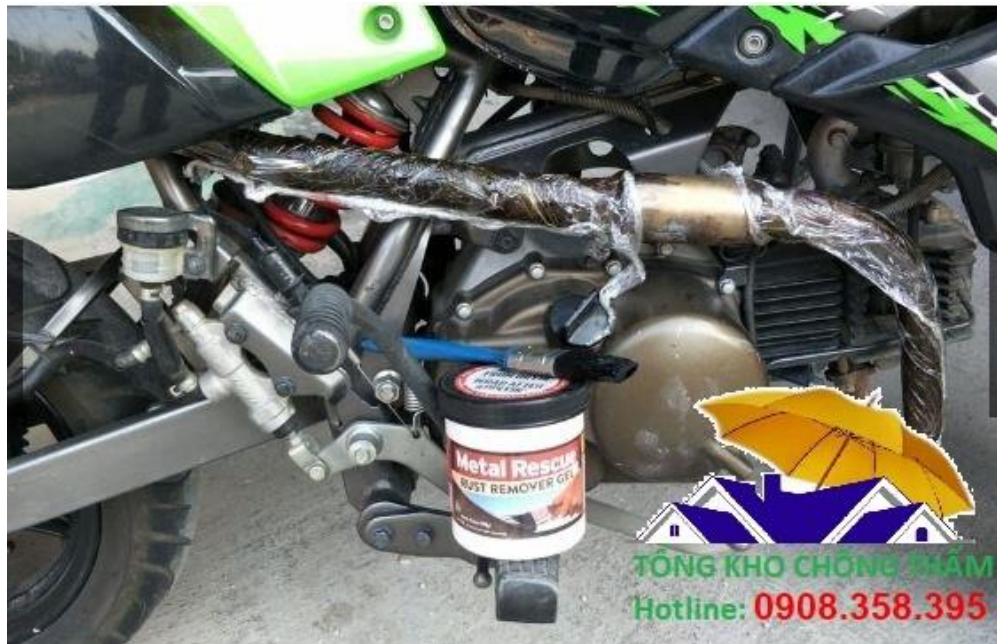
Gel tẩy rỉ FD-153 dùng cho xe máy