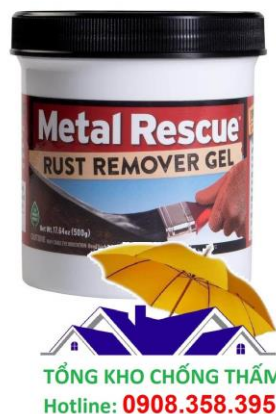
Gel tẩy rỉ sét kim loại Metal Rescue FD-153

Cách lưu trữ: Ở nơi thoáng mát, tránh ánh nắng và khí hậu ẩm ướt