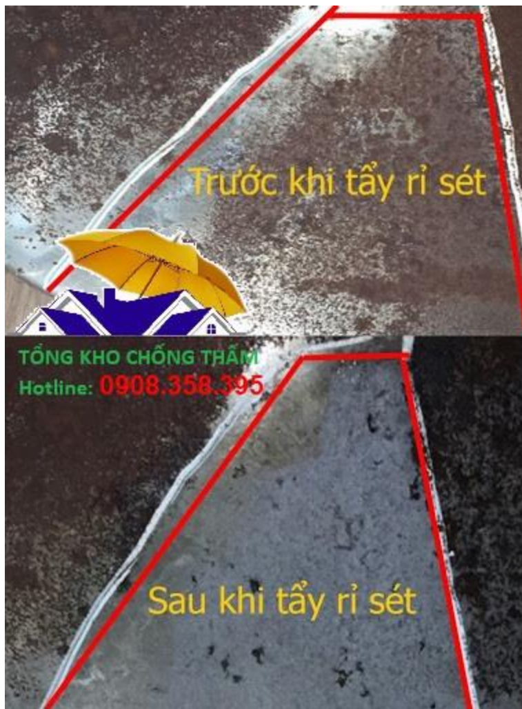
Sử dụng Gel tẩy rỉ sét kim loại hiệu quả, nhanh chóng