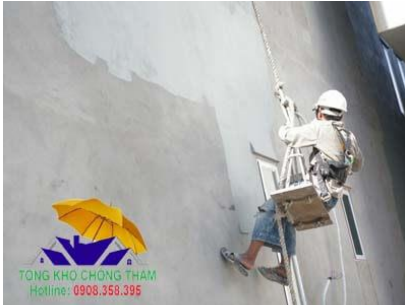
Cách thi công sơn chống thấm KCC cho tường đứng