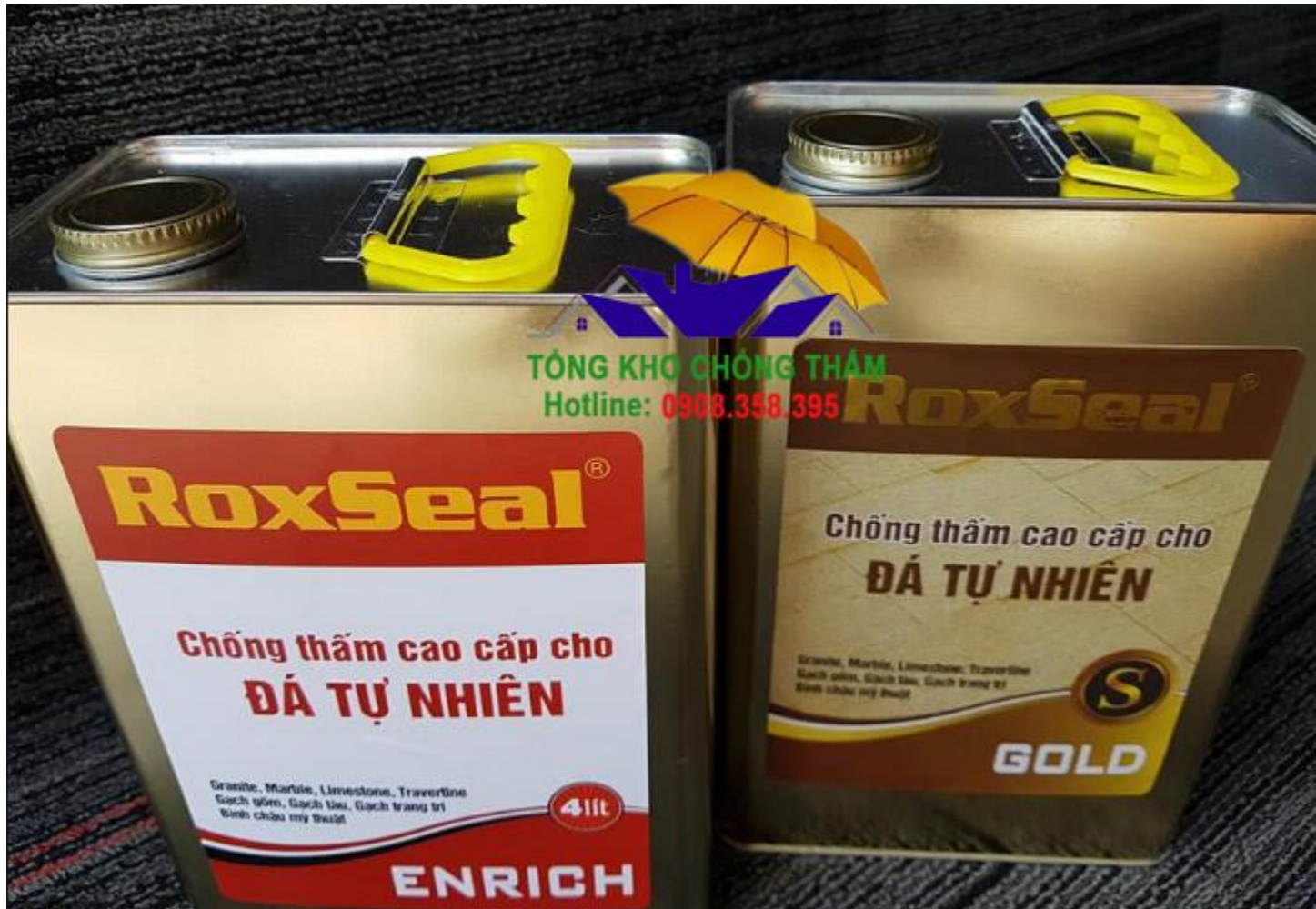
Chống thấm đá tự nhiên gốc dầu