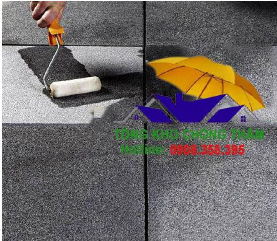
Cách chống thấm đá tự nhiên hiệu quả cao