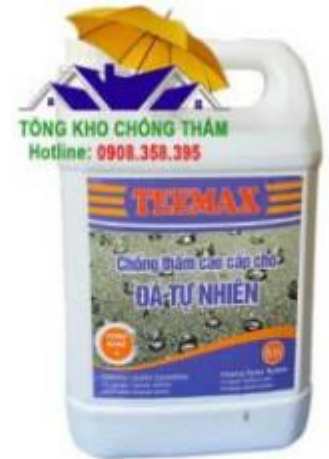
Chống thấm đá tự nhiên Teemax giá rẻ, chính hãng