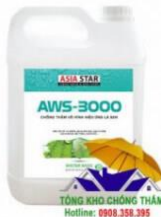
Chống thấm đá AWS 3000 không màu chính hãng