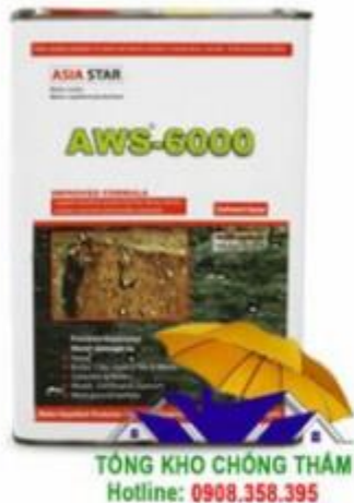
Dung dịch chống thấm đá AWS 6000 không màu chính hãng

Một số các loại chống thấm đá tự nhiên hiện nay