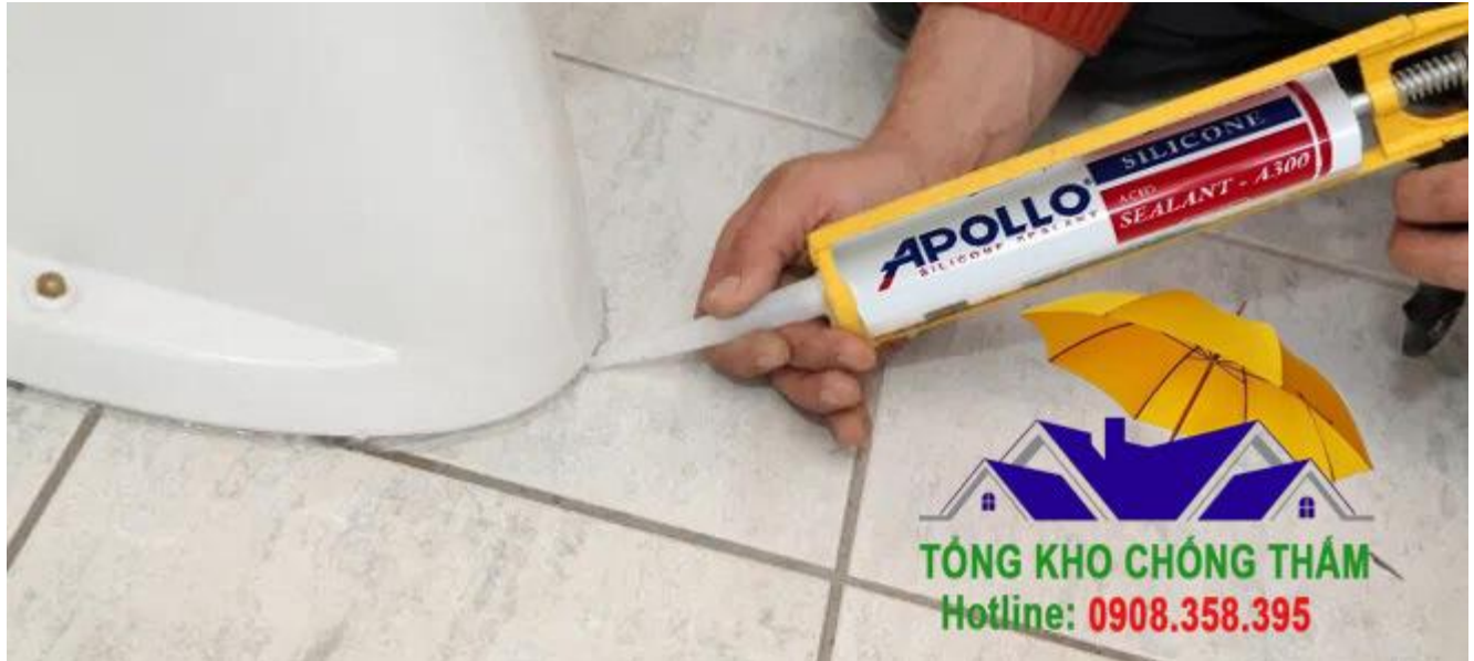
Keo Apollo ron bồn cầu

Keo Silicone Apollo A600 chính hãng, giá tốt tại Hà Nội