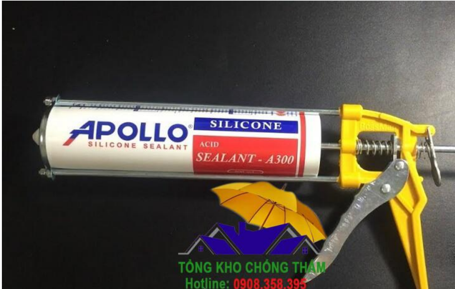
Cách cho keo vào súng Silicone