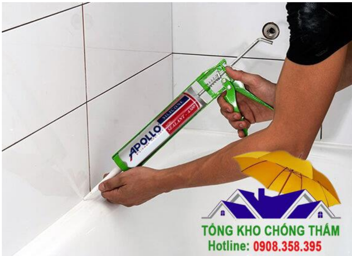
Keo Apollo ron gạch