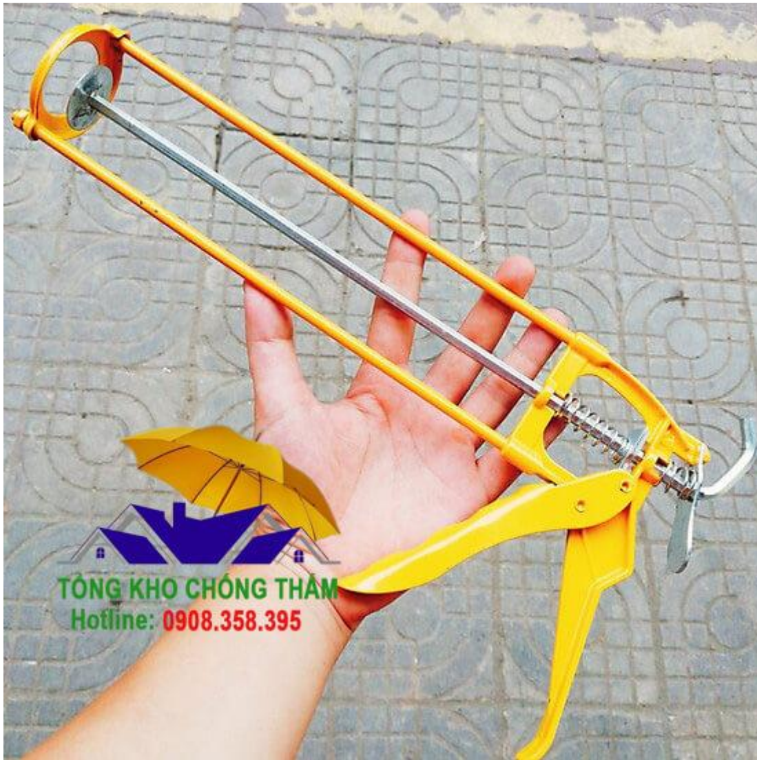
Hình ảnh rõ nét về súng Silicone Apollo