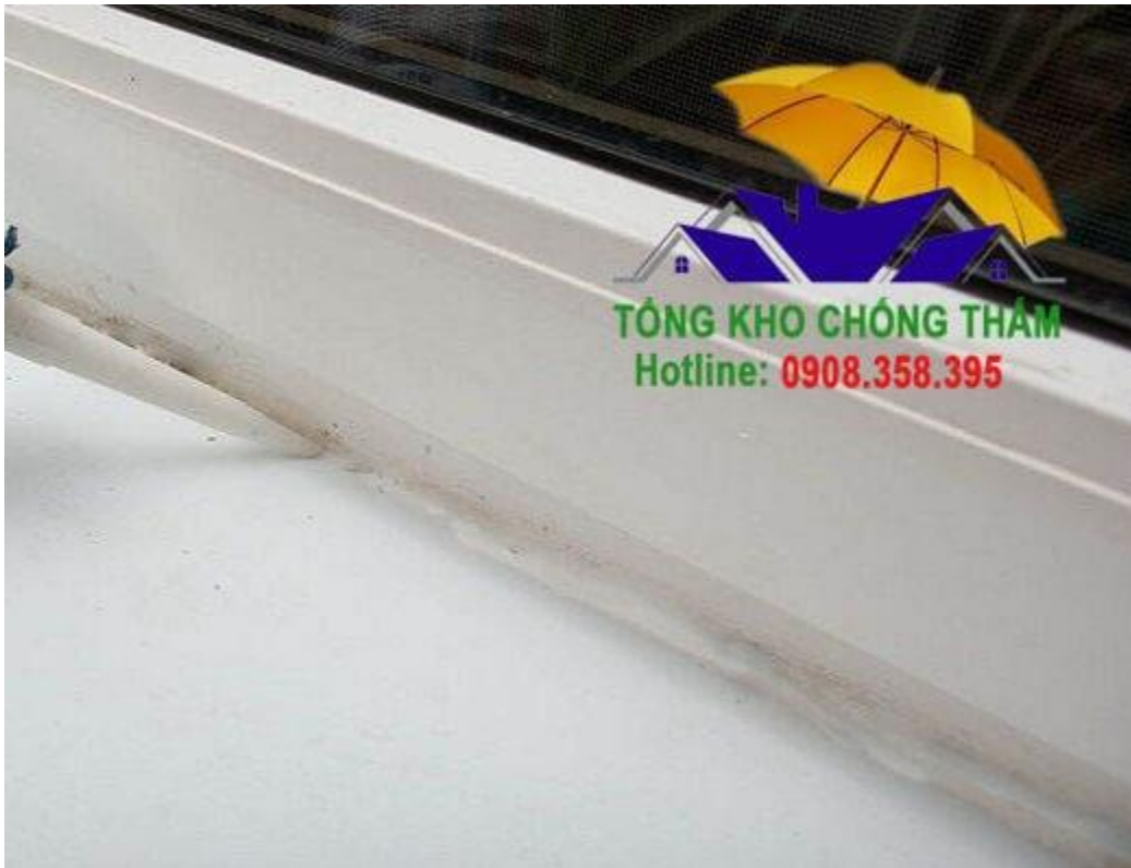
Lưu ý khi sử dụng