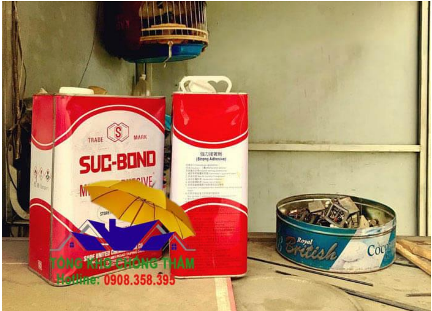
Keo dán bột