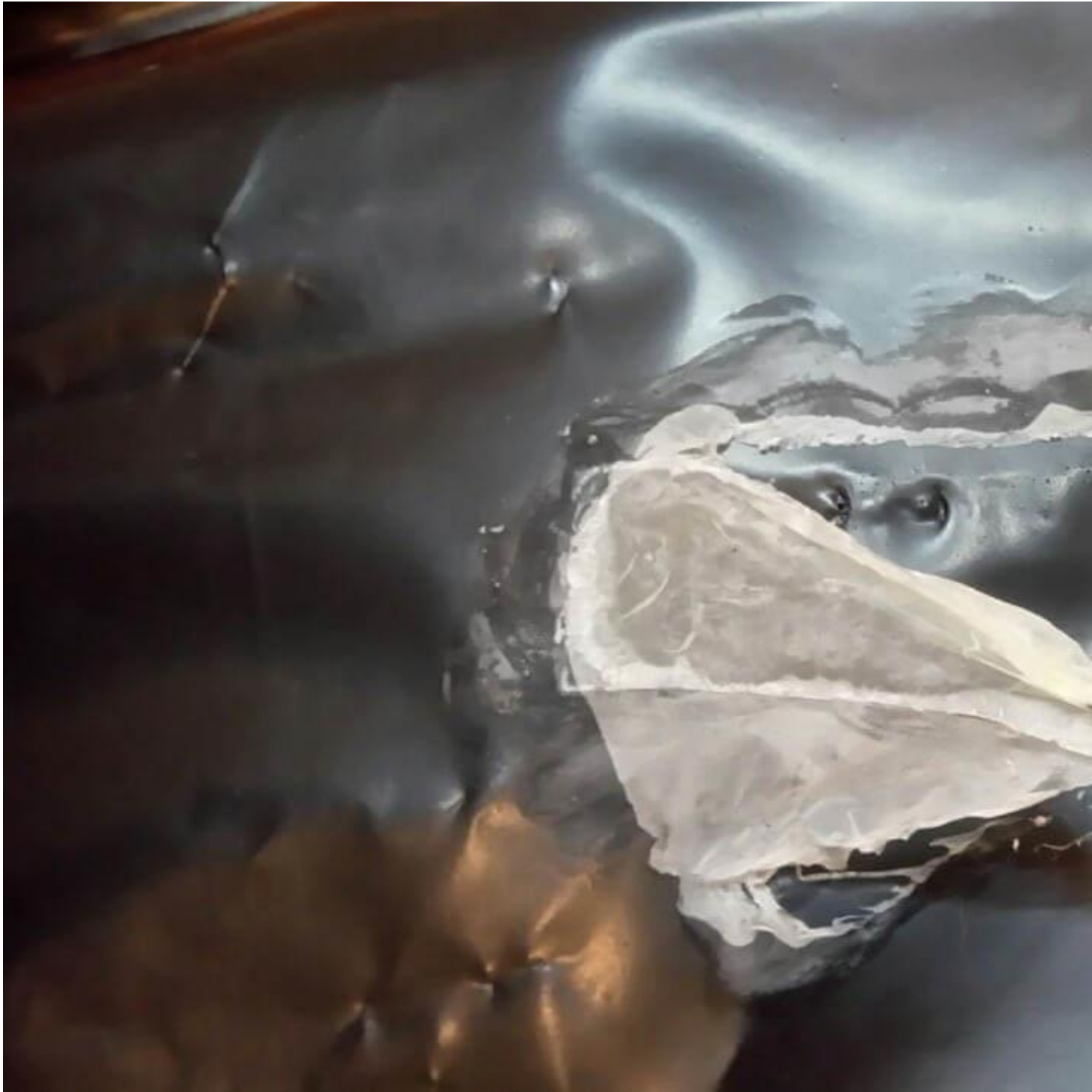
Cách sử dụng keo dán bạt