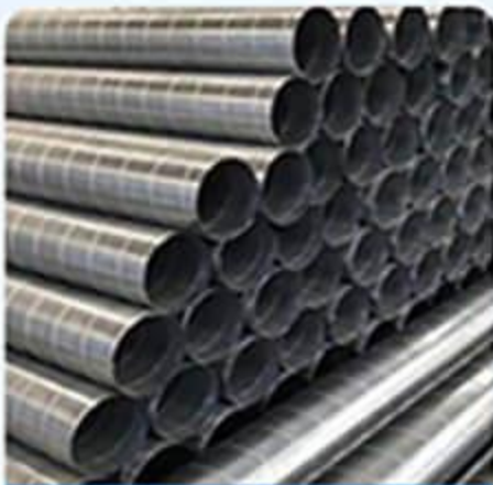
Ống thép không gỉ