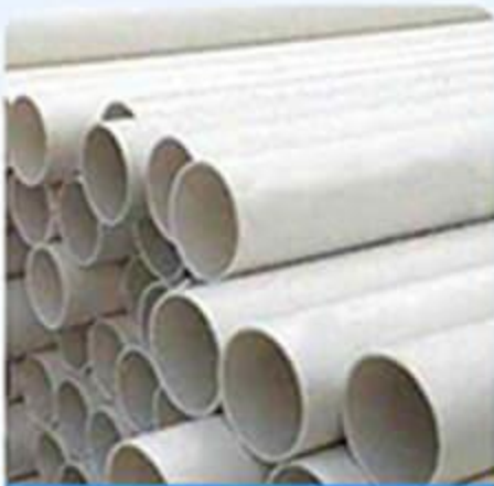
Ống nhựa PVC

TỔNG KHO CHỐNG THẨM Hotline: 0908.358.395