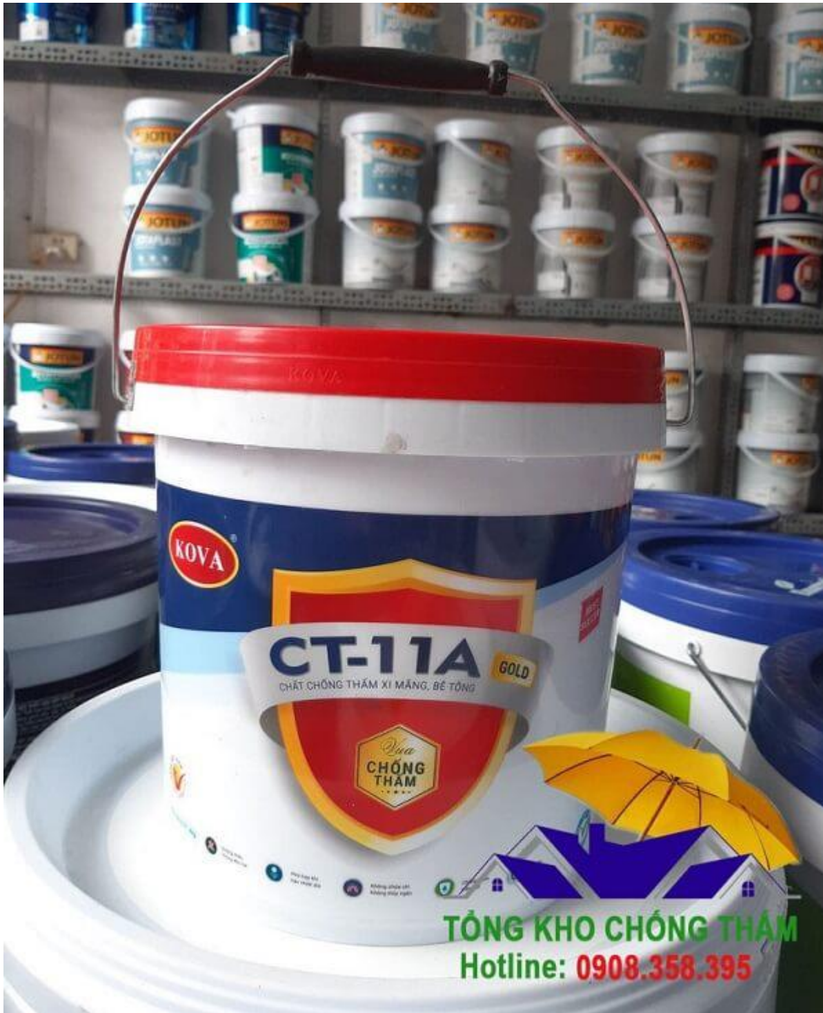
Hình ảnh rõ nét của Kova CT-11A Gold