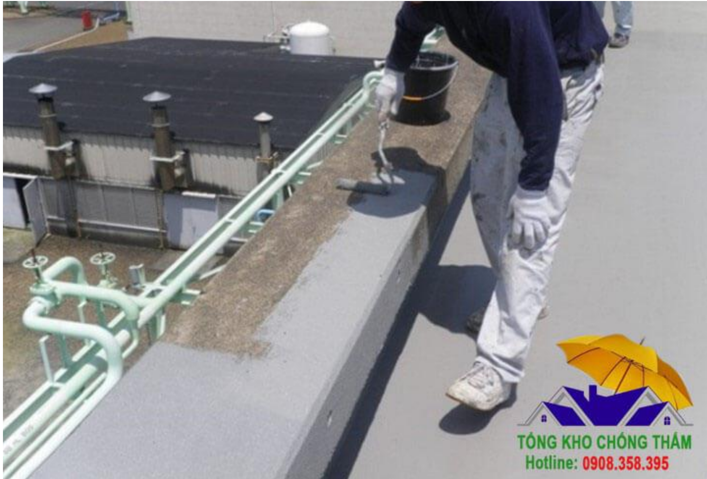
Hình ảnh thi công