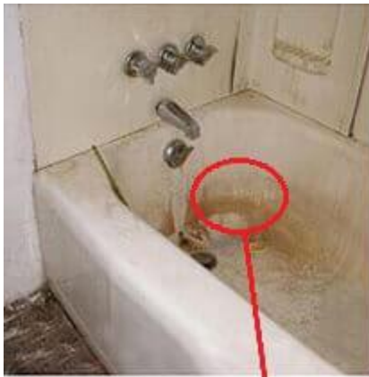
Bồn tắm bị ố vàng