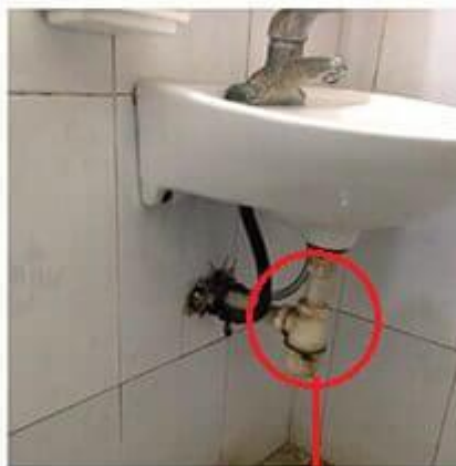
Bồn, đường ống nước, nền nhà bị ố vàng