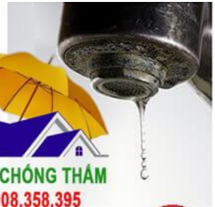
Vòi nước hoa sen bị tắc