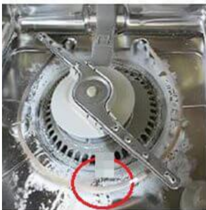
Lồng máy giặt, máy rửa bát bị tắc, đóng cặn