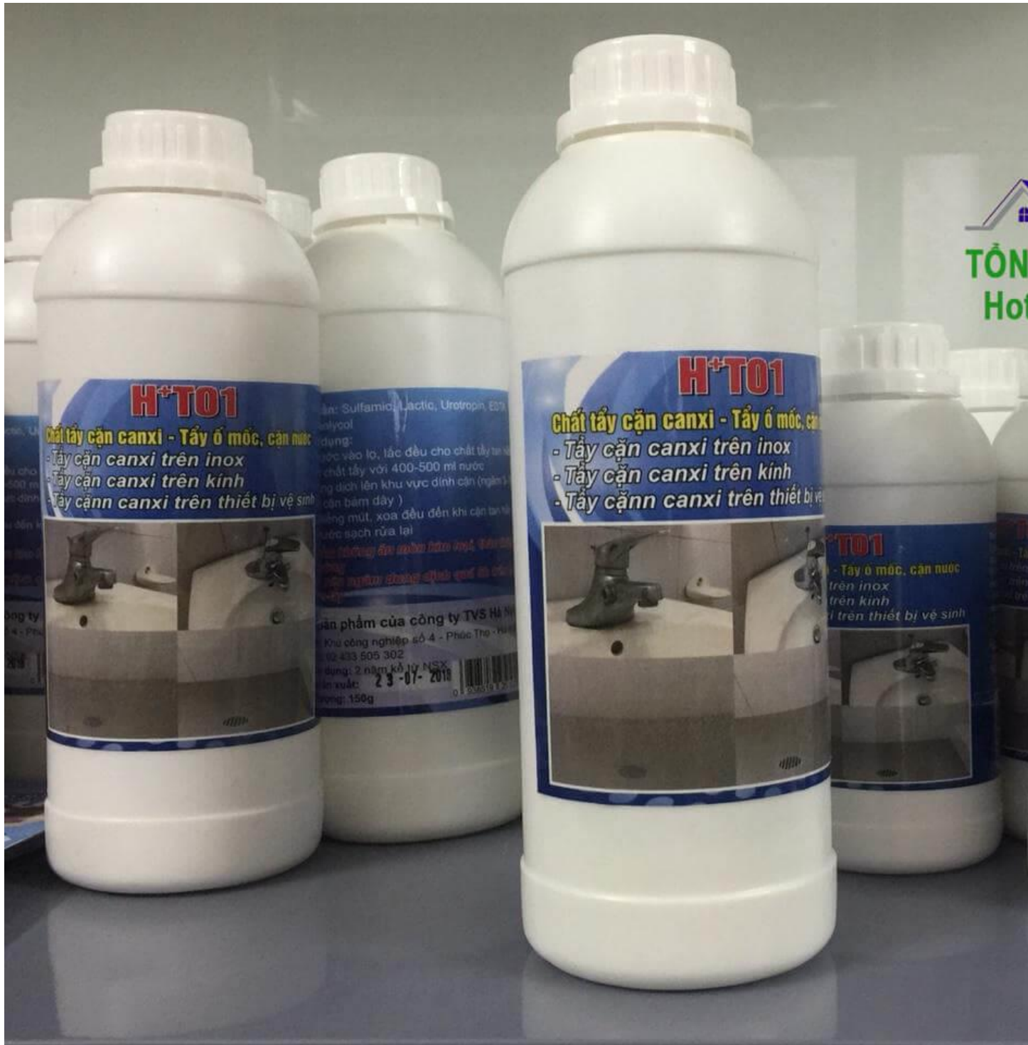
Chất tẩy cặn canxi