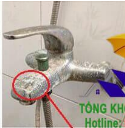
Vòi nước bị hoen rỉ, xỉn màu