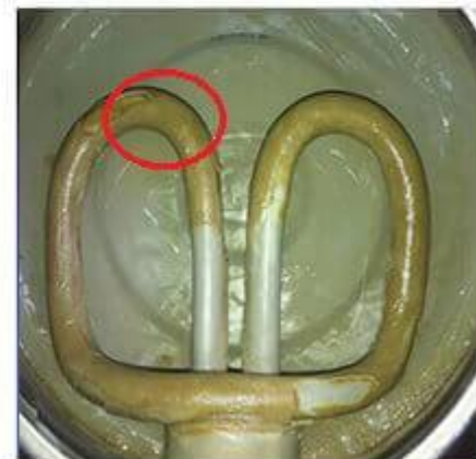
Bình đun, ấm đun nước bị đóng cặn hồng ruột