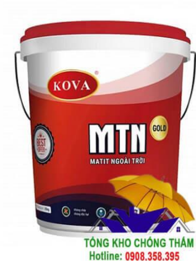
Kova MTN – Gold Matit ngoài trời