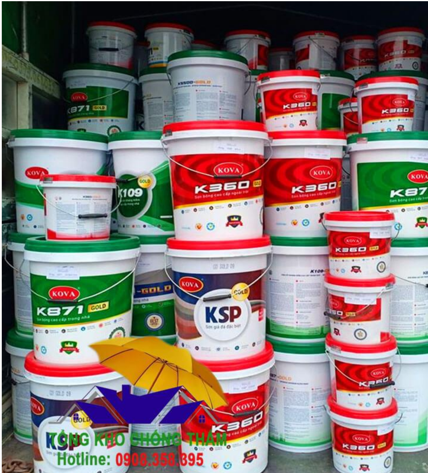
Cửa hàng sơn Kova Hà Nội