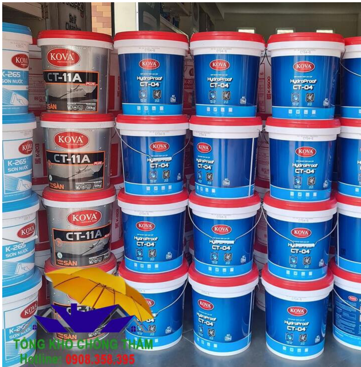
Tổng kho phân phối sơn chống thấm Kova