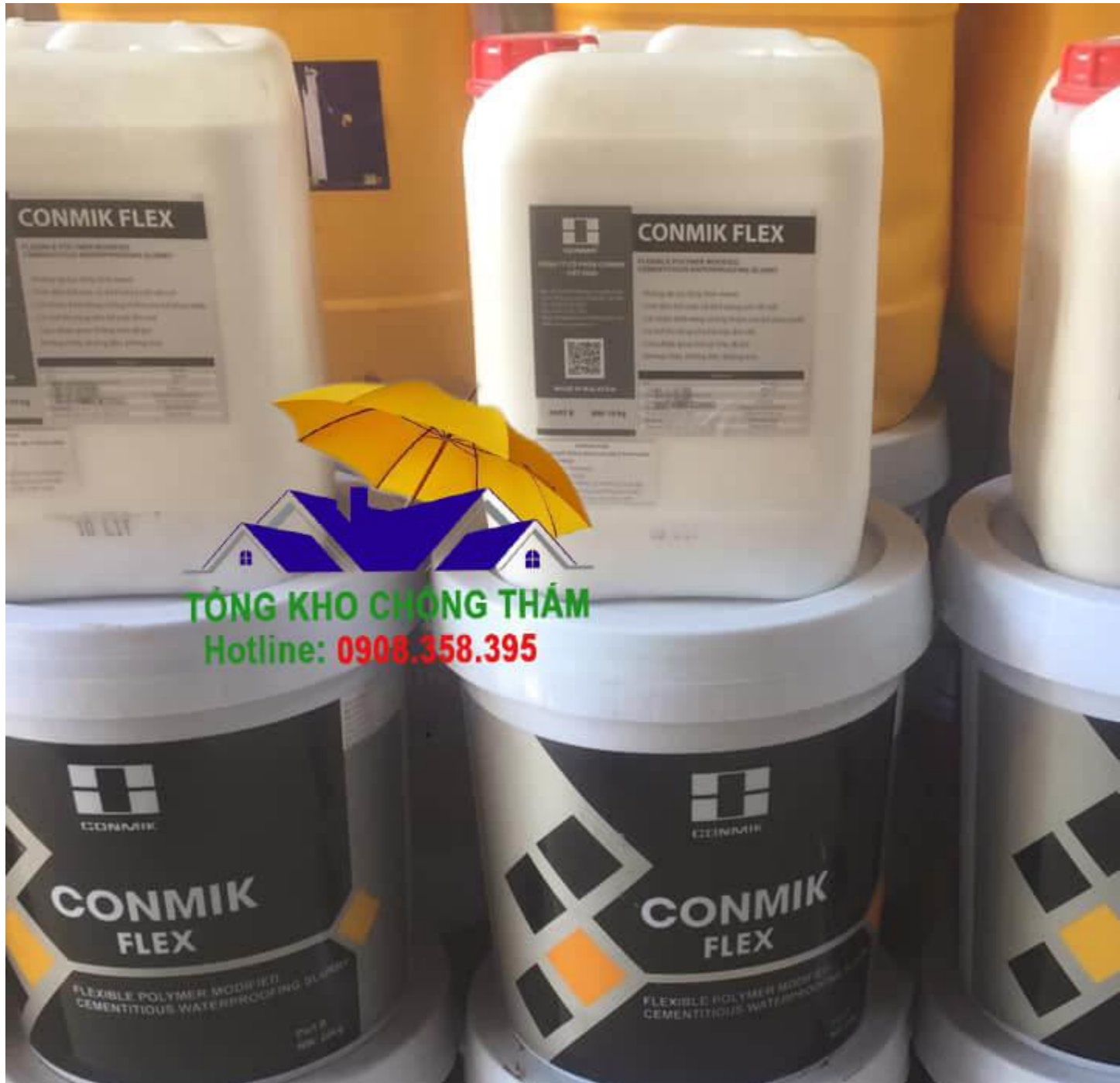
Cửa hàng cung cấp chống thấm