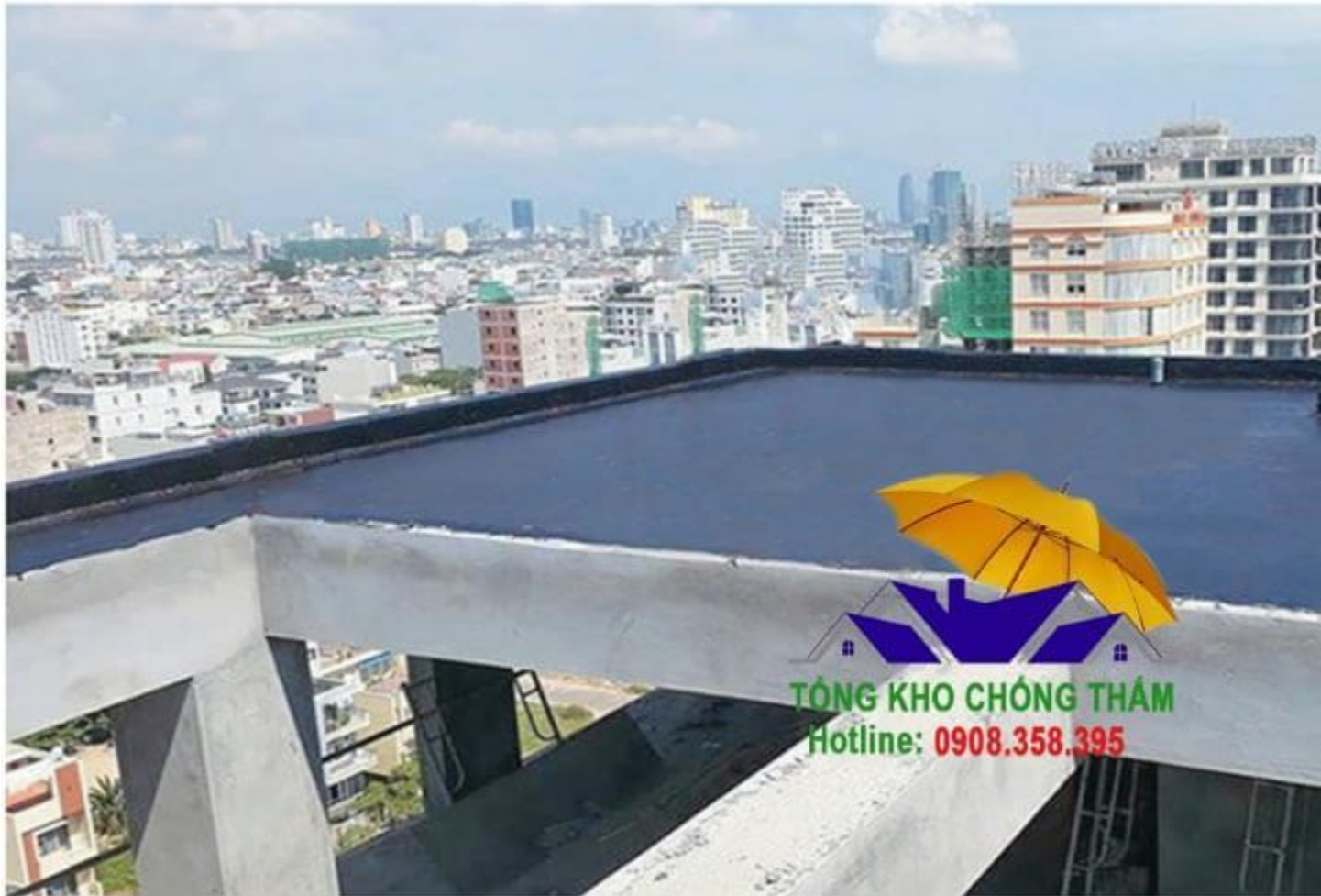
Chống thấm màu đen