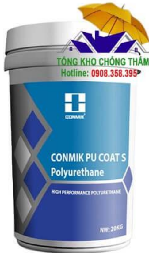
Conmik Pu Coat S Vật liệu chống thấm Polyurethane