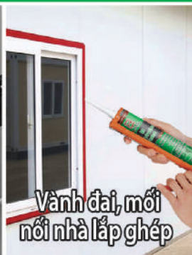
Vành đai, mối nối nhà lắp ghép