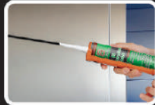
✓ Giảm thiểu loang bẩn (MS polymer)