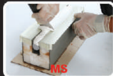
✓ Dễ thi công (MS sealant)