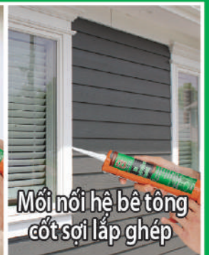
Mối nối hệ bê tông cốt sợi lắp ghép

Manufactured under ISO9001 & ISO14001 Management Systems