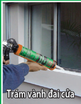
Trám vành đai cửa