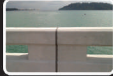
✓ Chống tia UV tốt (MS Polymer)