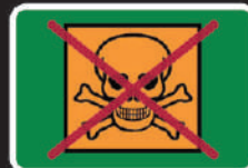
Vật liệu nguy hại (PU sealant)