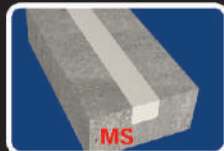
✓ Không co ngót (MS sealant)