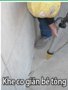
Khe co giãn bê tông