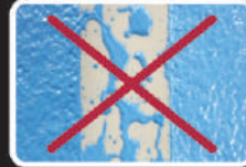
Không thể sơn phủ (Silicone sealant)