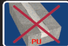
Co ngót (PU Sealant)