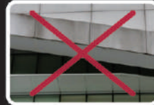
Loang bẩn (Silicone Sealant)