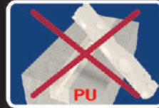
Tạo bóng khí (PU sealant)