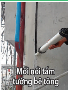
Mối nối tấm tường bê tông