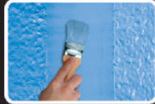
✓ Có thể sơn phủ (MS polymer)