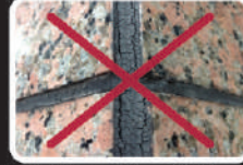
Chống tia UV kém, bị rạn nứt (PU sealant)