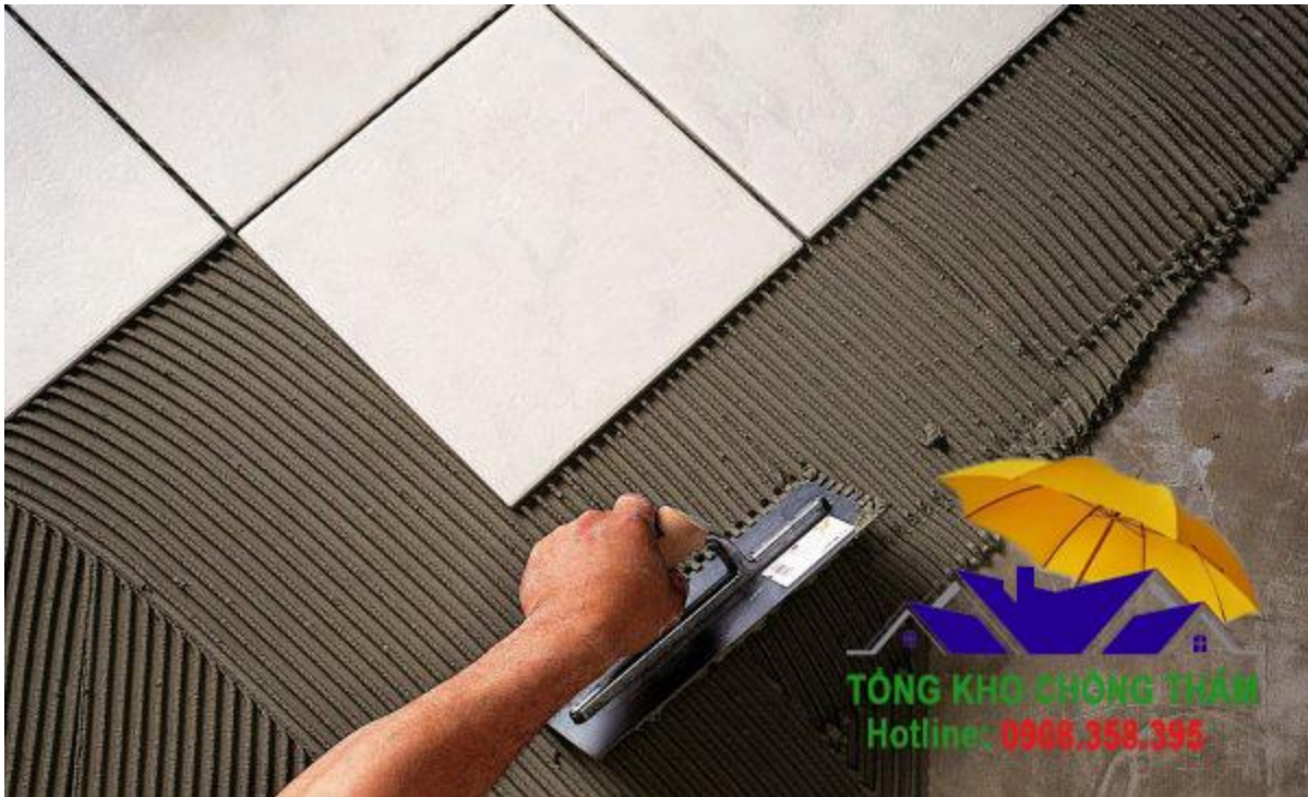
Phạm vi ứng dụng của weber tại gres