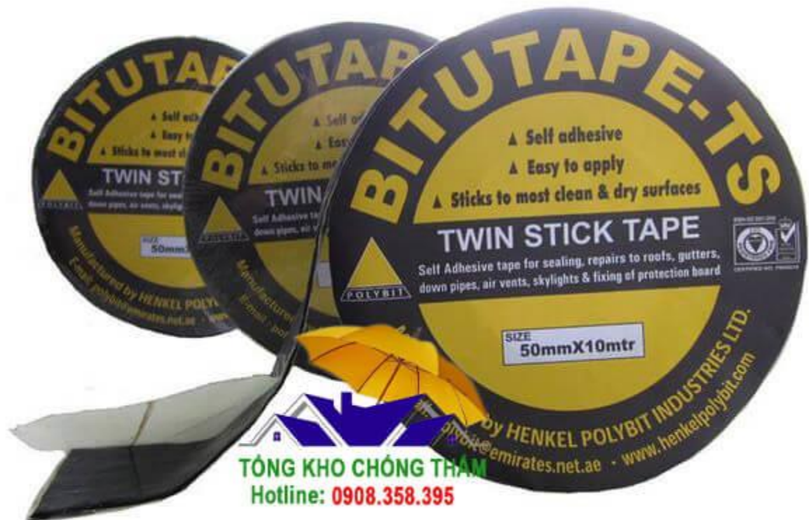
Hình ảnh rõ nét của BITUTAPE TS