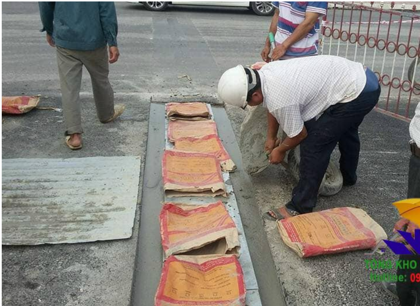
Vữa tự chảy