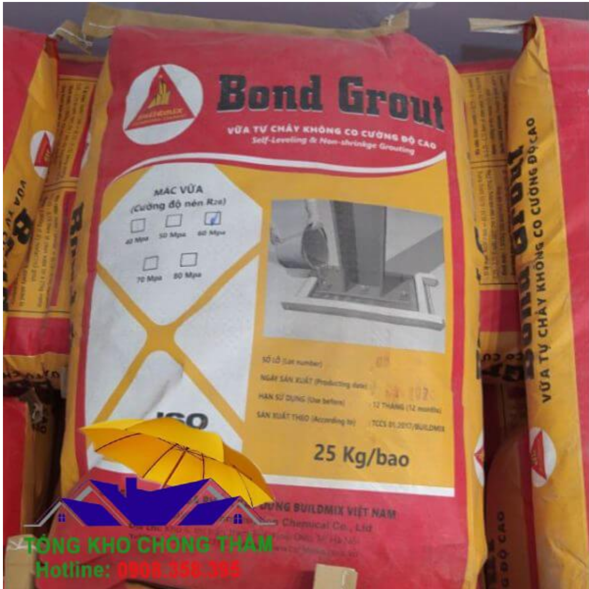
Hình ảnh Buildmix Bond Grout M60 chi tiết