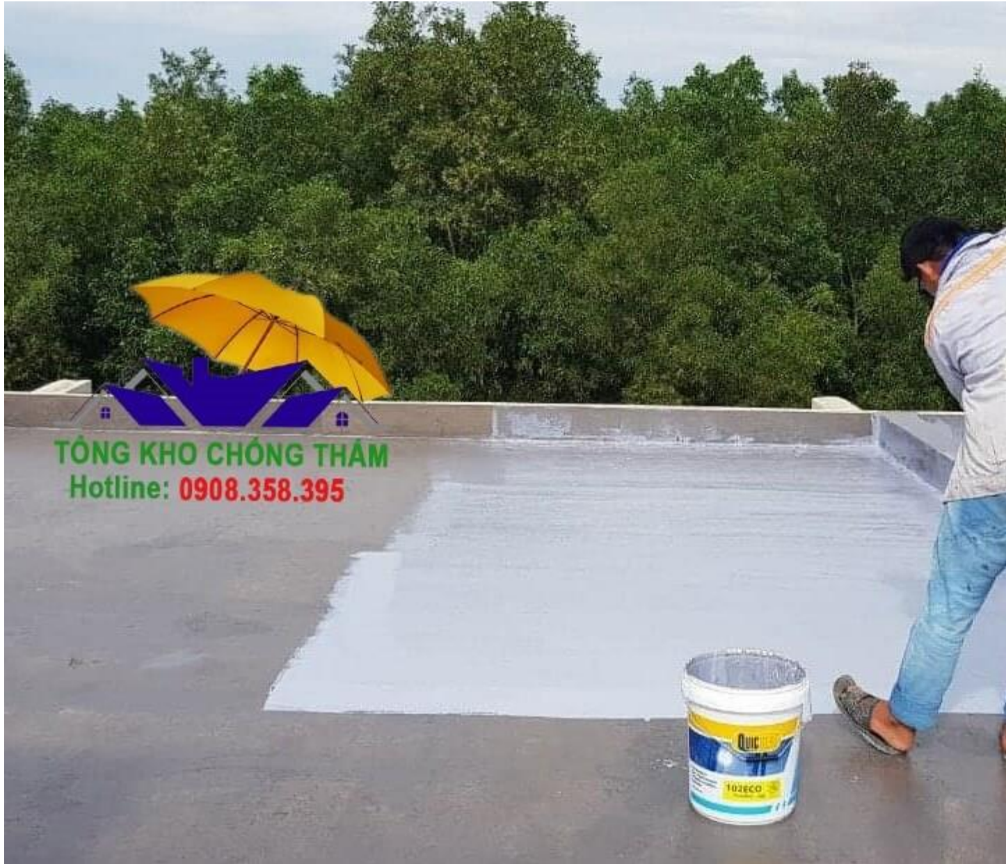
Thực hiện thi công