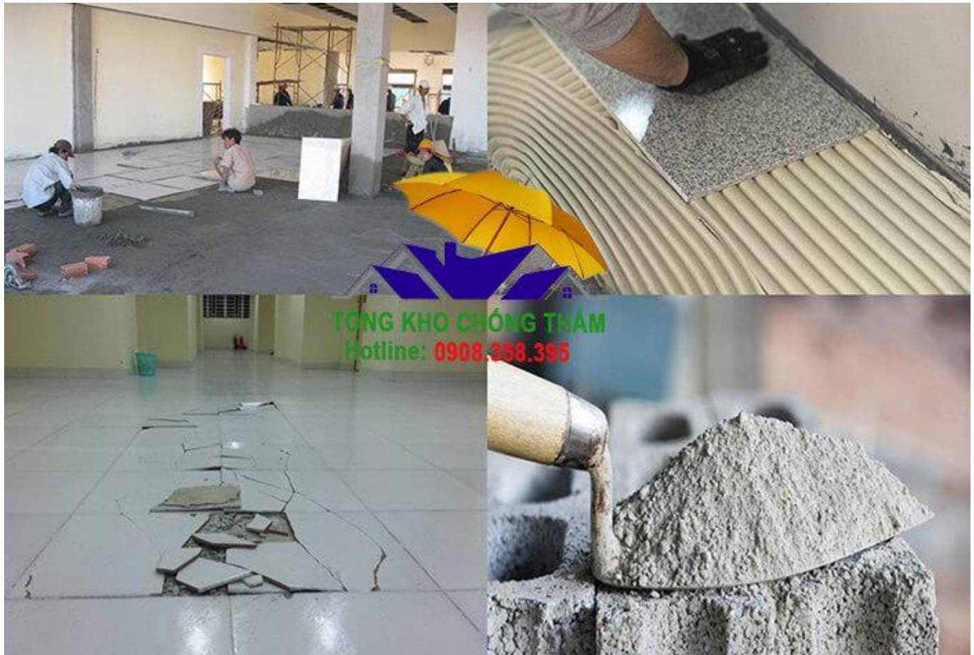
Hình ảnh minh họa

Cường độ bám dính sau lão hóa nhiệt: \geq 1.0 \text{ N/mm}^2