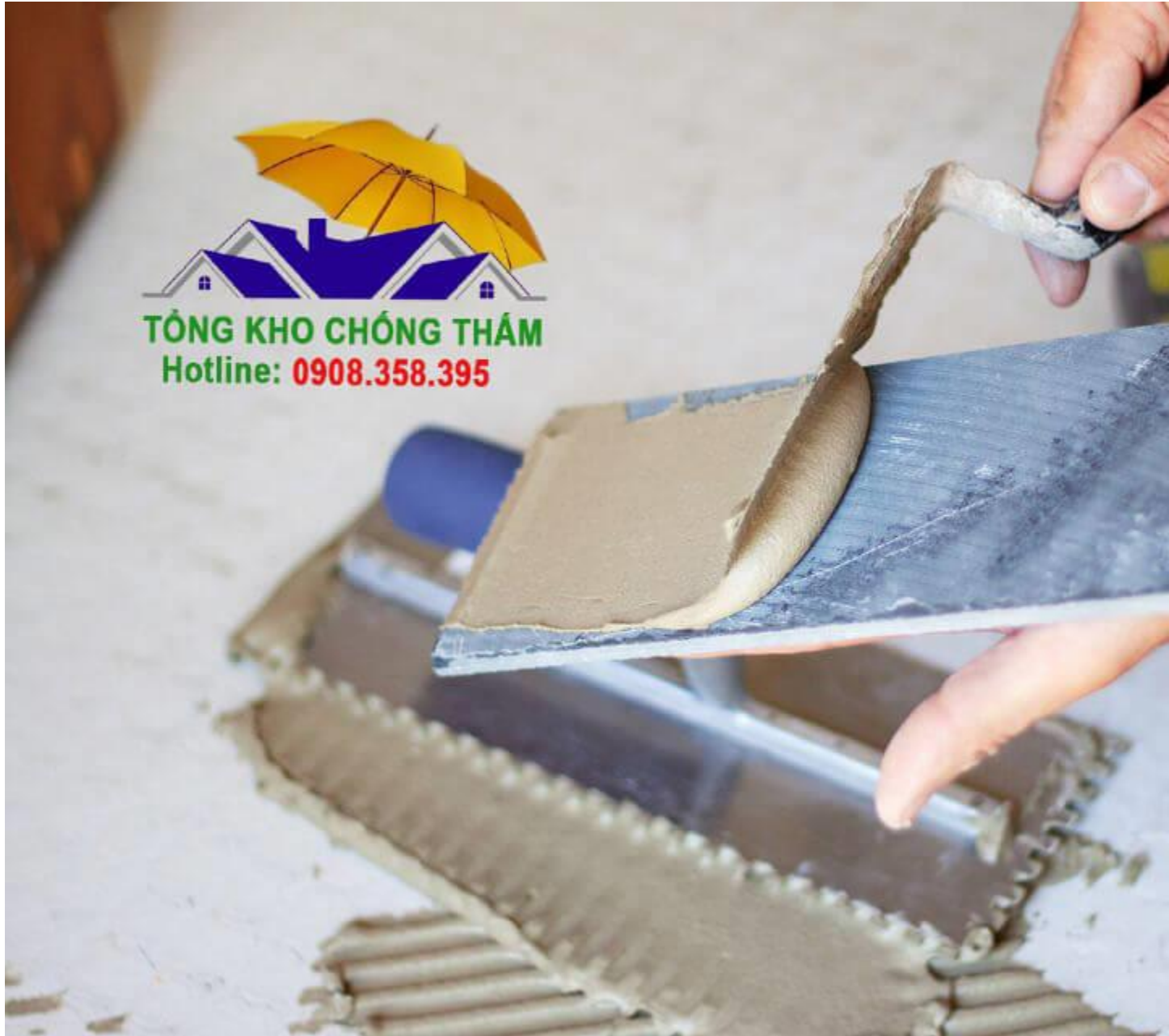
Trét keo lên gạch